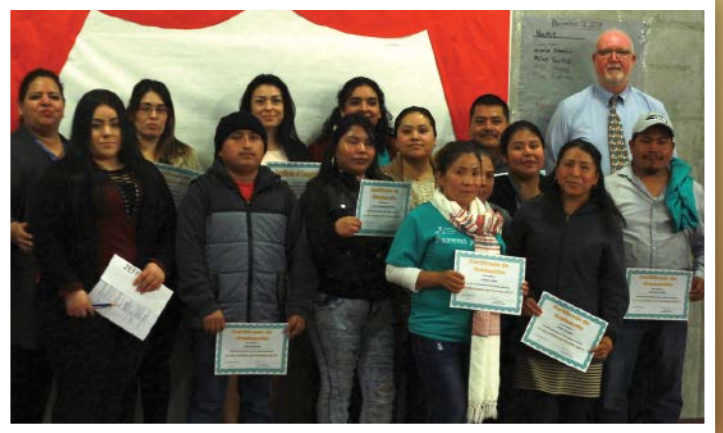
La Academia de padres fue un éxito enorme con aproximadamente 200 padres de estudiantes de los grados kínder a 12° que están aprendiendo maneras de ayudar a sus hijos a tener éxito. Las academias se enseñaron en inglés, español y ruso y se llevaron a cabo en las 9 escuelas del MVSD, incluso la MVHS.

Nuestras primeras clases de la Academia de padres fueron implementadas en el ciclo escolar 2015-2016 y participaron aproximadamente 80 padres de niños de primaria. Este año, en el programa participaron aproximadamente 200 padres y miembros de la familia de estudiantes de los grados kínder a 12°. Las clases se impartieron en inglés, español y en ruso y culminaron en una ceremonia de graduación el 7 de diciembre.