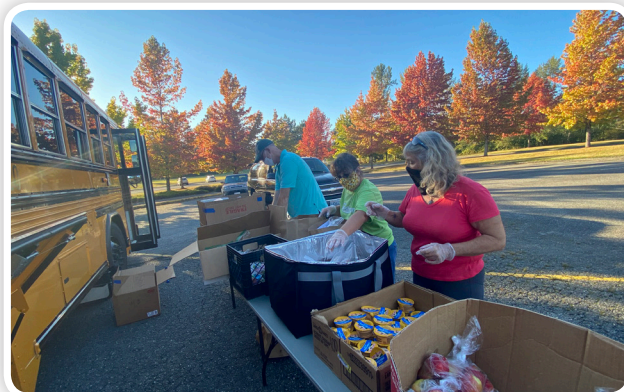
Personal de servicios nutricionales que proporciona comidas a las familias durante los servicios extendidos.