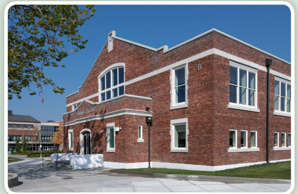
Edificio Administrativo de Mount Vernon High School

Todavía por venir como parte del Bono 2016 aprobado por los votantes es espacio adicional de salones en el campus de la preparatoria y espacio adicional de salones en la escuela secundaria La Venture.